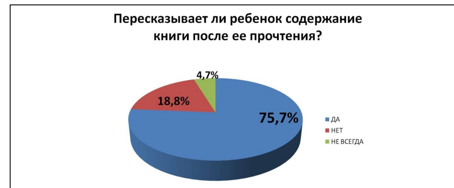
Рисунок 3. Использование пересказа при чтении в семье

При анализе ответов на восьмой вопрос – «Пересказывает ли ребенок содержание книги после ее прочтения?» видно, что 26 человек из 107 опрошенных не просят детей пересказать текст или делают это изредка (см. рисунок 3). Возможно, они не знают об эффективности этого способа воспитания у детей интереса и любви к чтению, формирования грамотной речи ребенка или считают его слишком сложным в применении.