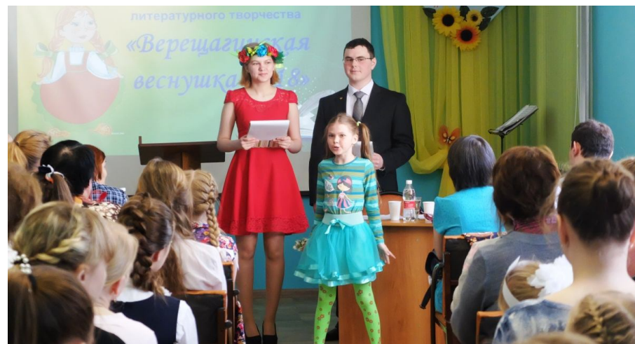
«Верещагинская веснушка – 2018»

Уже 19 лет в районе ежегодно проходит традиционный поэтический фестиваль «Верещагинская весна», организуемый сотрудниками центральной библиотеки им. В. Г. Мельчакова и участниками объединения «Подсолнух». Фестиваль проводится в марте и посвящается Международному дню поэзии. К нам приезжают «собратья по перу» из Очёра, Сивы, Карагая, а в 2016 году участники объединения стали инициаторами ещё одного литературного праздника – детского фестиваля литературного творчества «Верещагинская веснушка». Главная цель фестиваля – выявление, поддержка и развитие литературных способностей детей и подростков, популяризация их творчества. Теперь этот фестиваль также стал традиционным и проводится при поддержке центральной детской библиотеки.