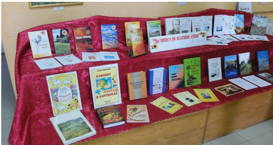
Издания верещагинских авторов