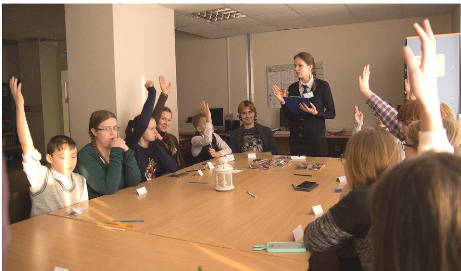
«Книжная ночь Гарри Поттера», 2017 г.