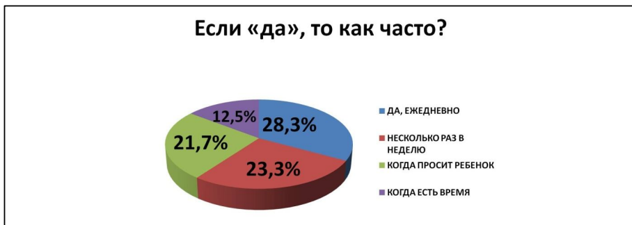
Рисунок 2. Чтение в семье

Для дальнейшего анализа анкет исследователи решили отсеять 17 респондентов, не читающих книги своим детям. Они сочли, что включение в анализ их ответов на остальные вопросы анкеты некорректно. В дальнейшем учитывались ответы 107 респондентов. Именно это количество родителей было взято за 100 %.