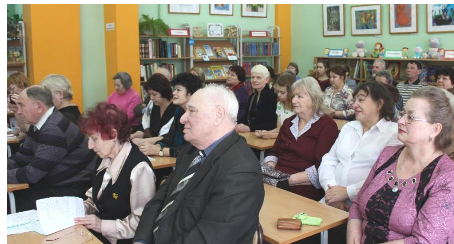
На фото: участники конкурса на заключительном мероприятии в Центральной библиотеке

Оглашение итогов конкурса и вручение дипломов состоялось 25 января 2018 года в Центральной библиотеке. На мероприятие были приглашены все участники конкурса со своими группами поддержки. Всего было вручено 14 дипломов, 6 из них остались в Чайковском, 8 разъехались по разным городам Удмуртской Республики.