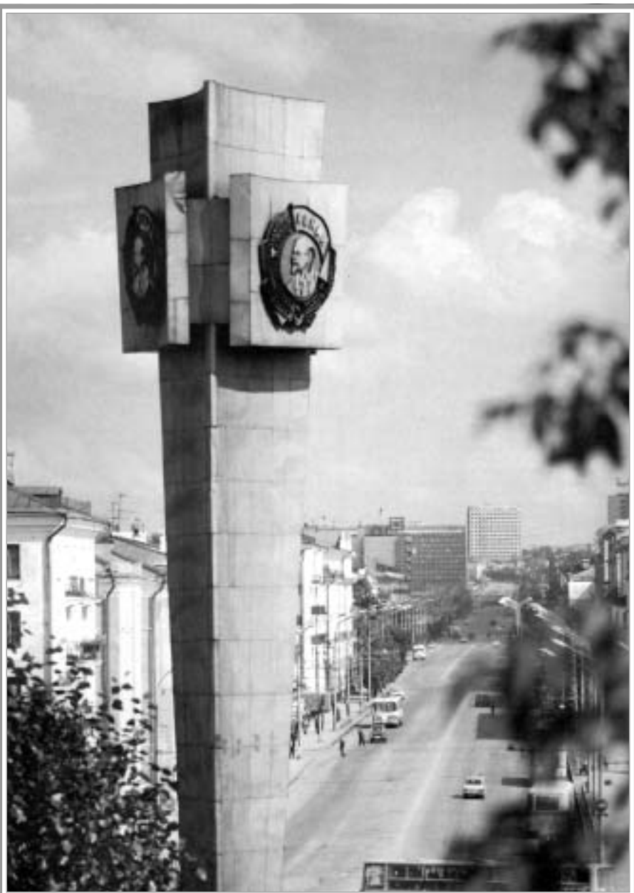
Стела в честь 250-летия города Перми у въезда на улицу Ленина.