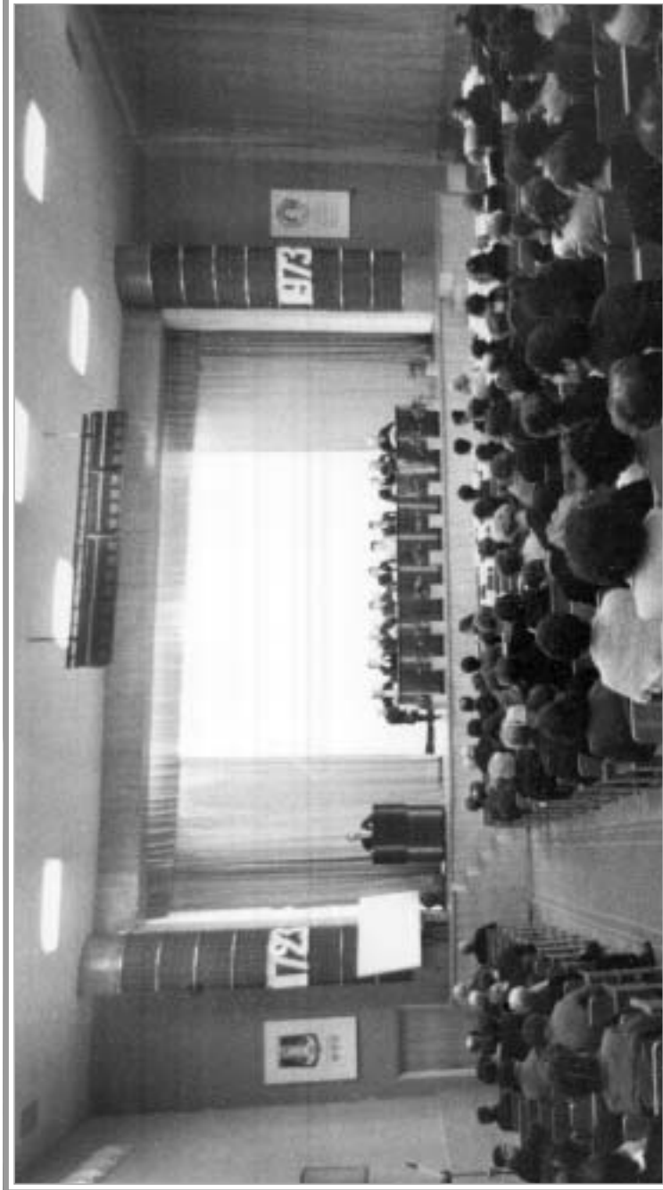
Конференция "Прошлое, настоящее и будущее Перми" в государственном университете. Ноябрь 1972 г. ГАПК. Ф/ф. Оп. 61п. Д. 05756.