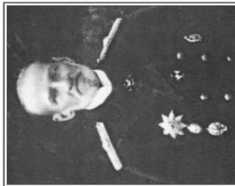
Вице-губернатор В.И. Европеус.