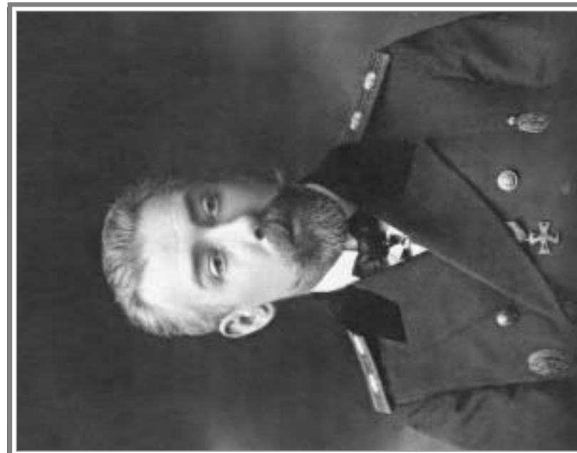
Губернатор И.Ф. Кошко.