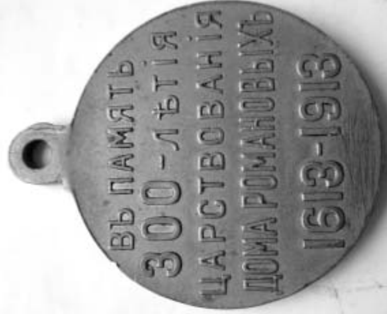
Юбилейная медаль "В память 300-летия царствования Дома Романовых".