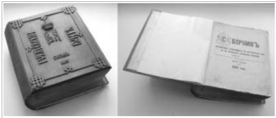
Книга В.Н. Шишонко "Пугачевский бунт" в Музее истории Екатеринбурга.