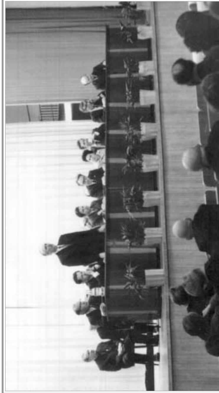
Конференция "Прошлое, настоящее и будущее Перми" в государственном университете. Ноябрь 1972 г. ГАПК. Ф/ф. Оп. 61п. Д. 05754.