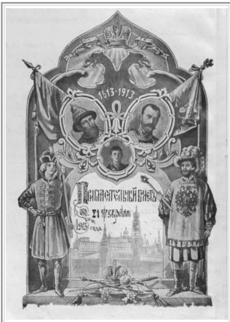
Приглашение И.М. Цветкову. ГАПК. Ф. 35. Оп. 1. Д. 228. Л. 49.