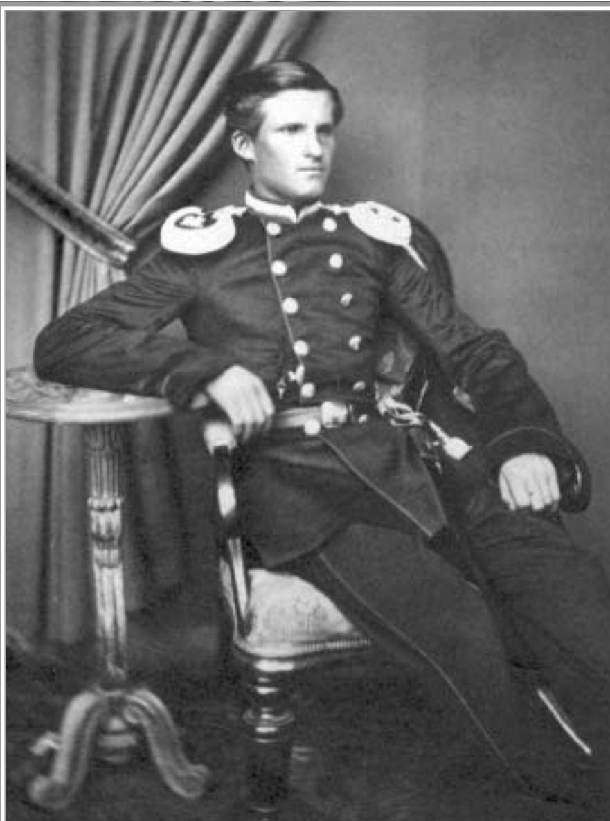
Капитан 7-го Оренбургского линейного батальона. 1850-е гг. (к статье Д.А. Лобанова "Горные батальоны").